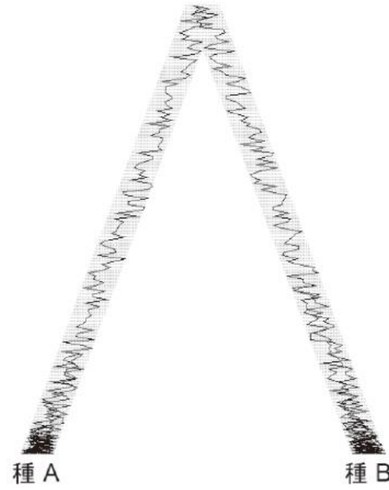
図6.1 種間の多様性と種内の多様性

(a) 種分化と絶滅、系統樹。時間は下から上へ流れている。(b) 種A, 種Bの2種における遺伝子の祖先からの系譜を遡る、合祖過程。時間は上から下へ流れている。